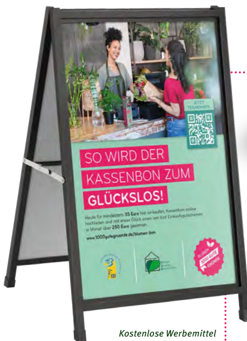
Kostenlose Werbemittel sind in Ihrem Cash & Carry-Markt erhältlich.