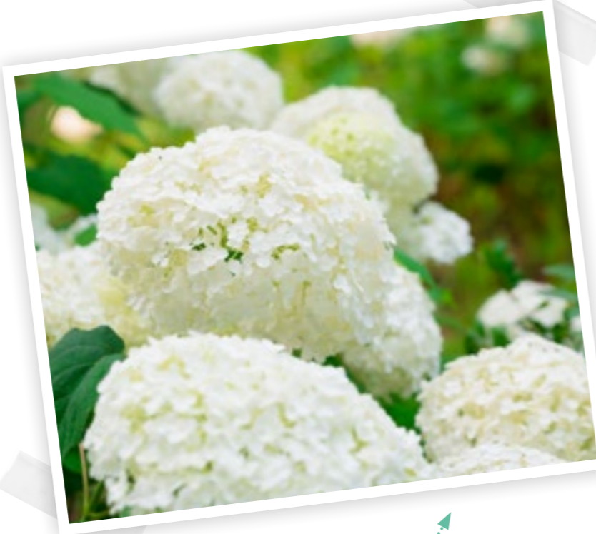
DIE BALLHORTENSIE BEEINDRUCKT MIT IHREN RIESIGEN WEISSEN BLÜTENBÄLLEN.

Ein unschlagbarer Vorteil des beliebten Duos: Hydrangea und Hosta passen nicht nur wunderbar in den Bauerngarten, sie sind dazu auch ausgesprochen pflegeleicht. Beachtet man einige wichtige Punkte, erfreuen beide Gewächse Gartenfreunde viele Jahre lang mit schönen Blüten und sattem Grün. Als ursprüngliche Waldbewohner fühlen sie sich sowohl im Garten als auch als Kübelpflanzen an schattigen bis halbschattigen Plätzen besonders wohl. Zwar gibt es heute bereits einige spezielle Züchtungen, die mehr Licht tolerieren – bei dem Großteil der vielfältigen