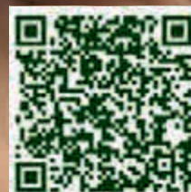
QR-Code für Google play