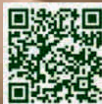
QR-Code für App Store